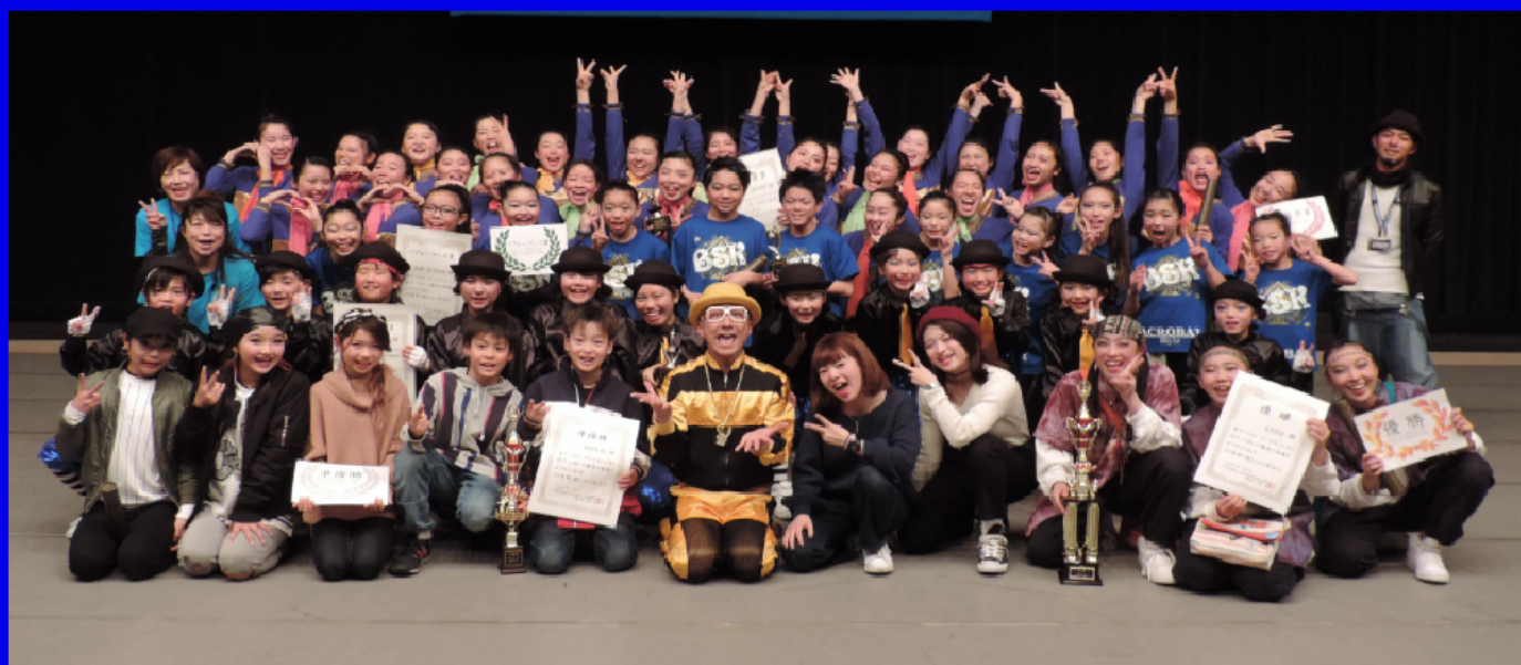
ダンスコンテスト 2017 出場者