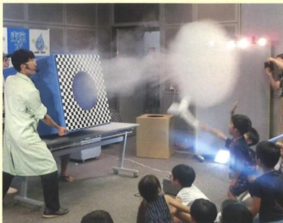
世界一の大型空気砲の実験